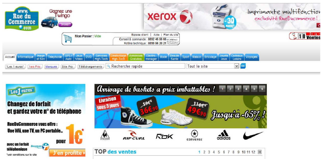
(Aperçu du site)

Le site rue du commerce a pour but de vendre du matériel High-tech à des clients, il est donc adressé à un public assez large (amateurs ou professionnel). Comme rue du commerce est un site de vente en ligne (régulièrement visité grâce à son adresse internet intuitive), celui-ci est régulièrement mis à jour au moins une fois par jour, bien que celui-ci ne présente aucune date clairement visible sur le site, mais repérable par les nouveautés ajoutées régulièrement. Il est également possible de les contacter soit par téléphone ou par voie postale. Le site présente dans un premier temps une interface plutôt satisfaisante pour un site de vente en ligne, bien que l'on aurait aimé voir mieux, mais ce site pour un client nomade donne plutôt envie de rester.